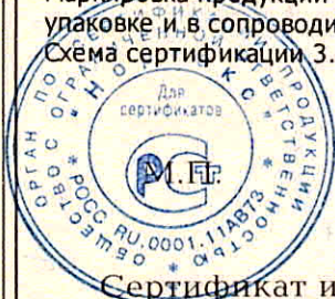
Схема сертификации З.

Маркировка продукции знаком соответствия производится по ГОСТ Р 50460-92. Место нанесения знака соответствия на упаковке и в сопроводительной документации.